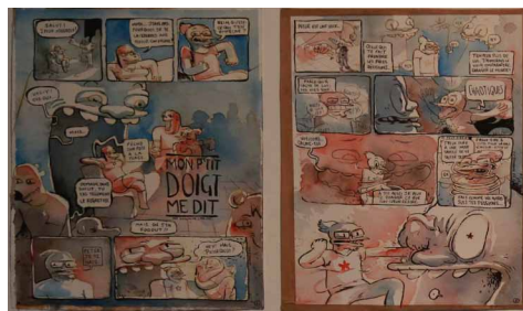
Guillaume Clarisse - DNAP 2016