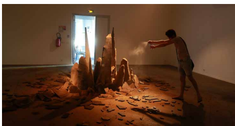
Ludovic Legros - DNSEP 2016 © ESA Réunion