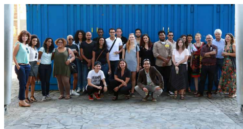
Diplômés DNSEP 2016

De nombreux événements proposés aux étudiants rythment les étapes de la recherche : expositions, résidences, workshops, ateliers de recherche & création (ARC), séminaires, journées d'études, éditions, etc.