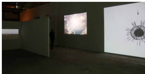
Exposition «Distorsion» La Friche - 2016