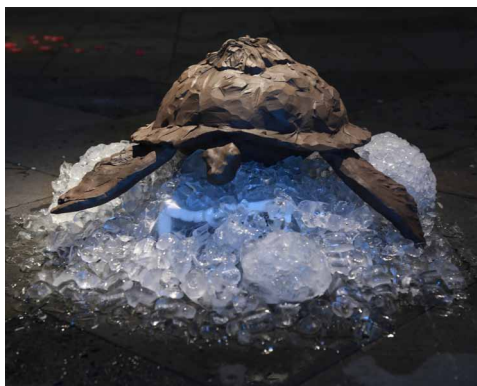
Restitution Atelier Céramique - DNSEP 2016

L'ESA Réunion est habilitée depuis 2015 à être centre valideur des acquis et de l'expérience en arts plastiques.